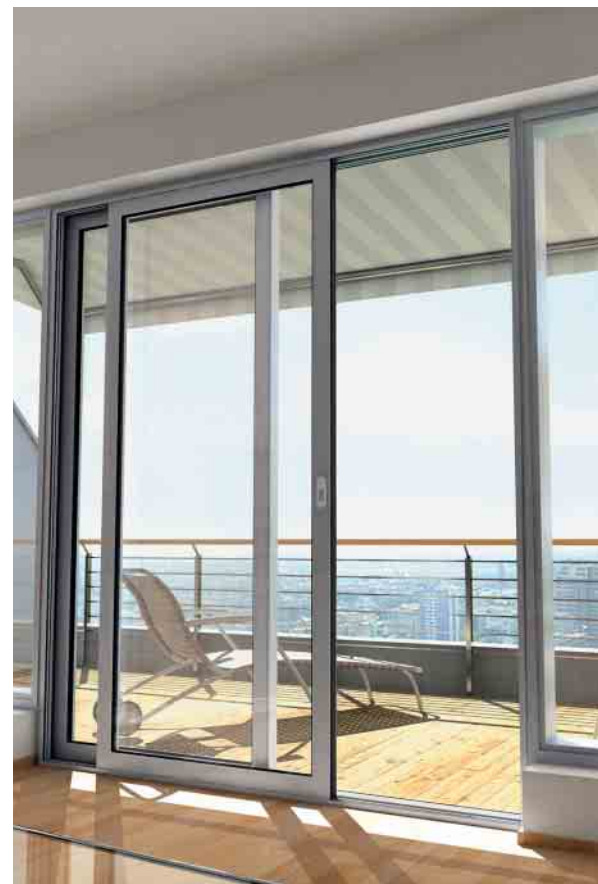
Schüco e-slide – verdeckt liegendes Antriebssystem concealed drive system

As the Schüco e-slide fitting is fully automatic, an anti-finger trap is integrated in the sliding and lift-and-slide systems.