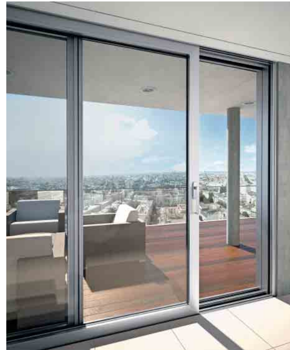
Schüco ASS 70 – hochwärmegeädämmtes Hebe-Schiebesystem high insulation lift-and-slide system

A Schüco lift-and-slide door made from aluminium profiles is very easy to move. When closed, the door is perfectly weathertight, providing excellent thermal insulation and sound reduction. Up to three tracks allow large opening widths and the door can therefore be used with great flexibility in large glass constructions.