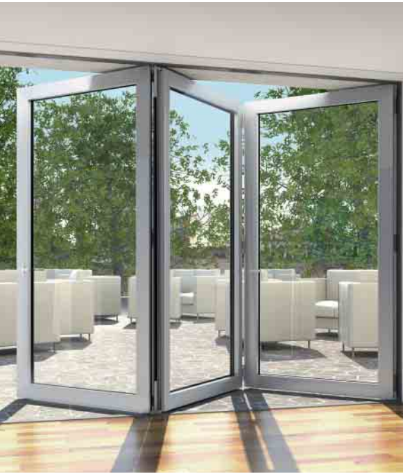
Schüco ASS 70 FD – wärmegeädämmtes Faltschiebesystem Schüco ASS 70 FD – thermally insulated folding sliding system