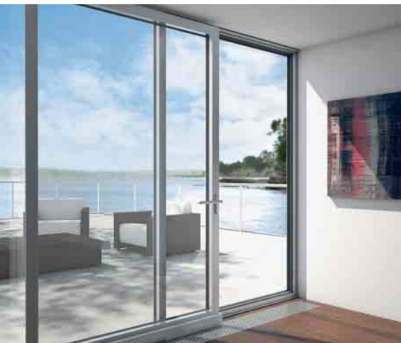
PASK-Fenstertüren bieten variable Lüftungsmöglichkeiten Tilt / slide window doors offer the best possible ventilation options

The non-insulated folding sliding door is the ideal choice in areas where no additional thermal insulation is required. The door system can be opened fully to extend offices, business rooms and living areas.